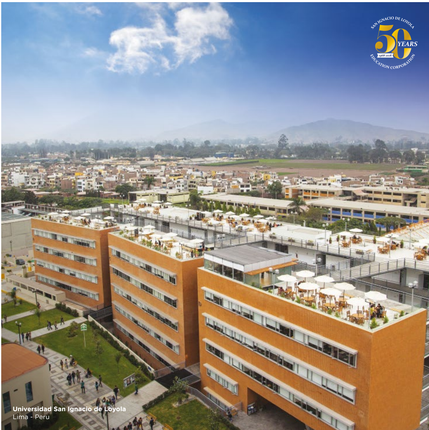
Universidad San Ignacio de Loyola Lima - Peru