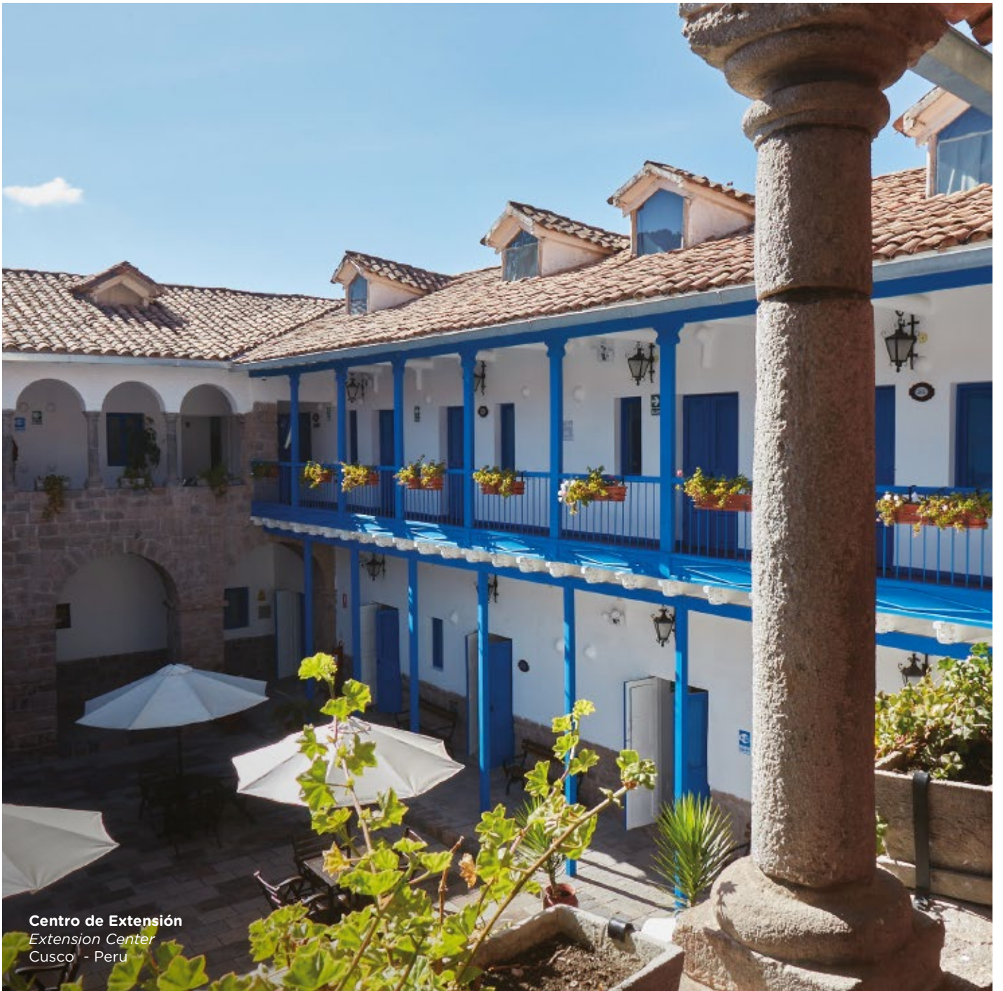
Centro de Extensión Extension Center Cusco - Peru