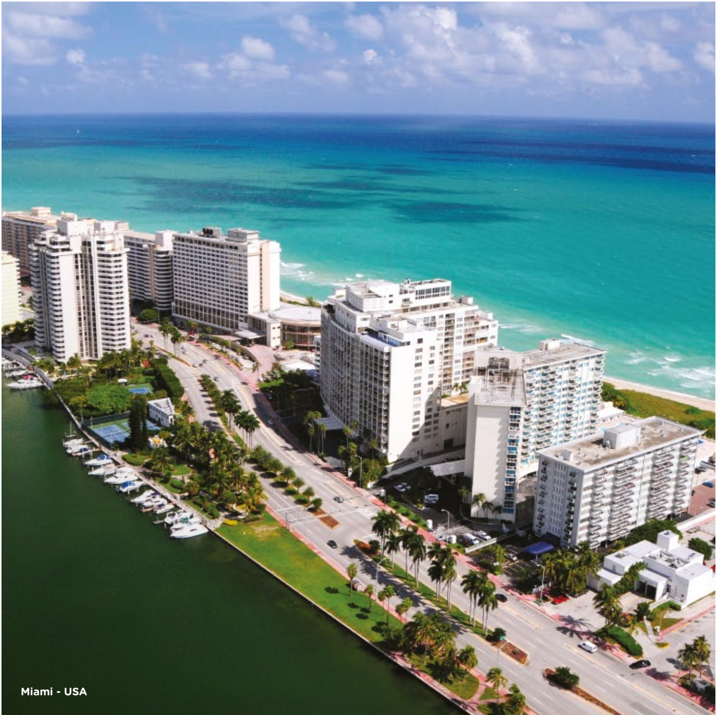
Miami - USA