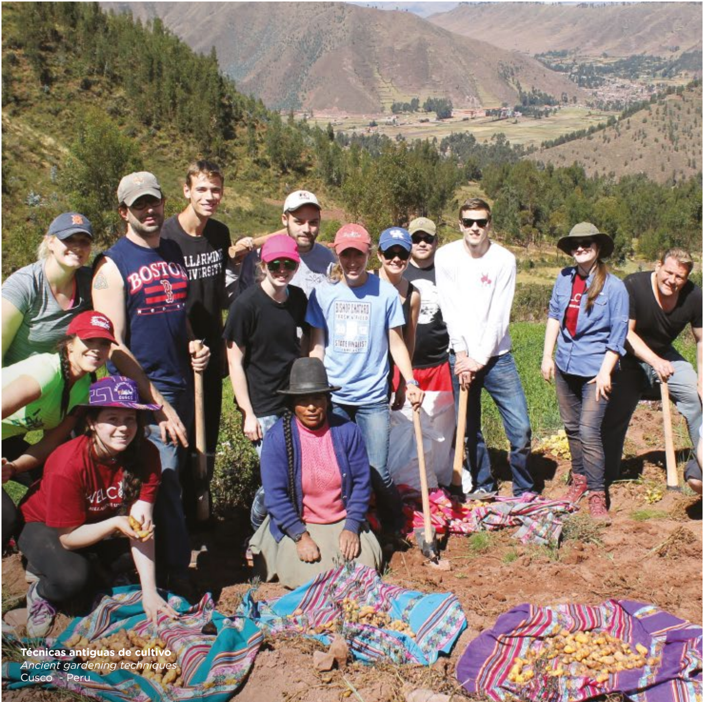
Técnicas antiguas de cultivo Ancient gardening techniques Cusco - Peru