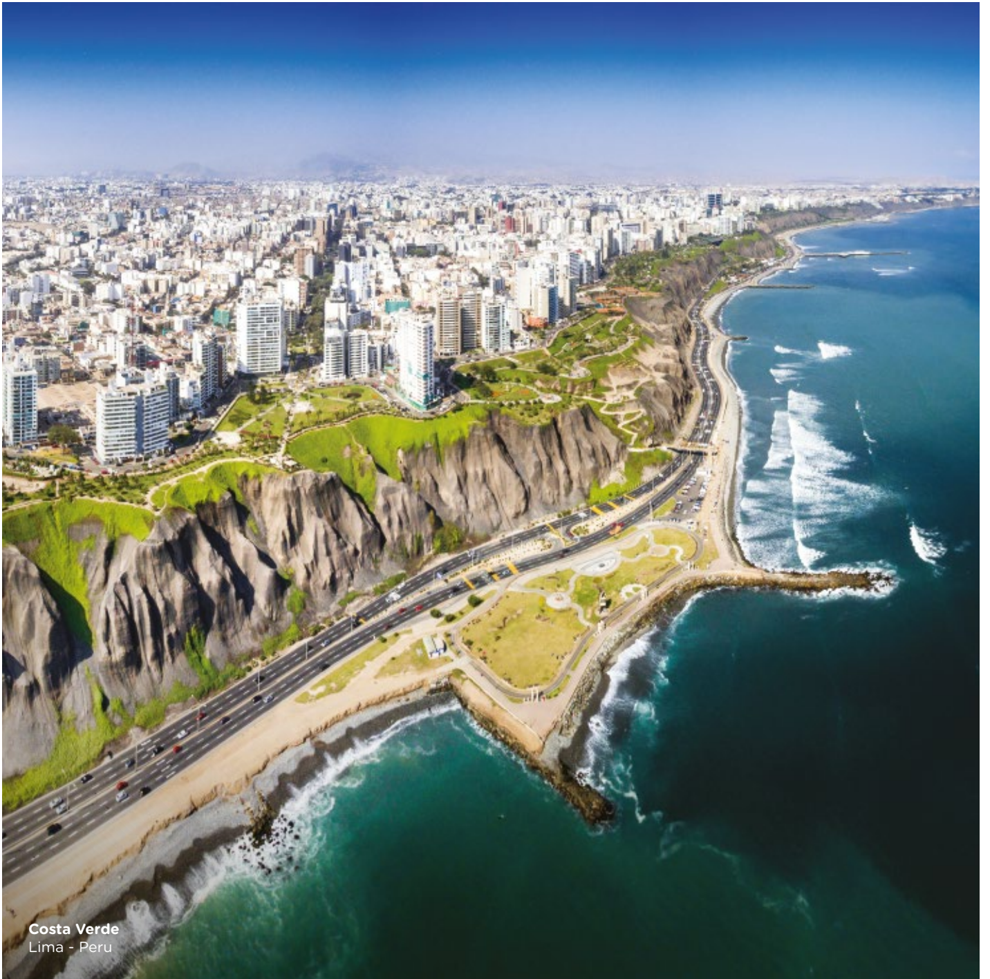
Costa Verde Lima - Peru